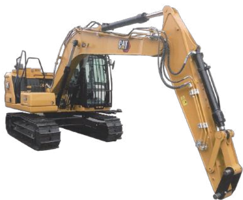
油圧ショベル 313 林業仕様

C3.6ディーゼルエンジン採用でエンジン出力が大幅に向上し、力強くハイパフォーマンスな作業を支えます。