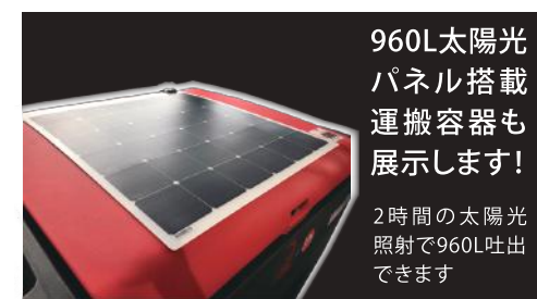
960L太陽光 パネル搭載 運搬容器も 展示します！ 2時間の太陽光 照射で960L吐出 できます