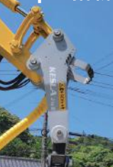
ストロークハーベスタ ローラーハーベスタ 全機種で Jtipを採用